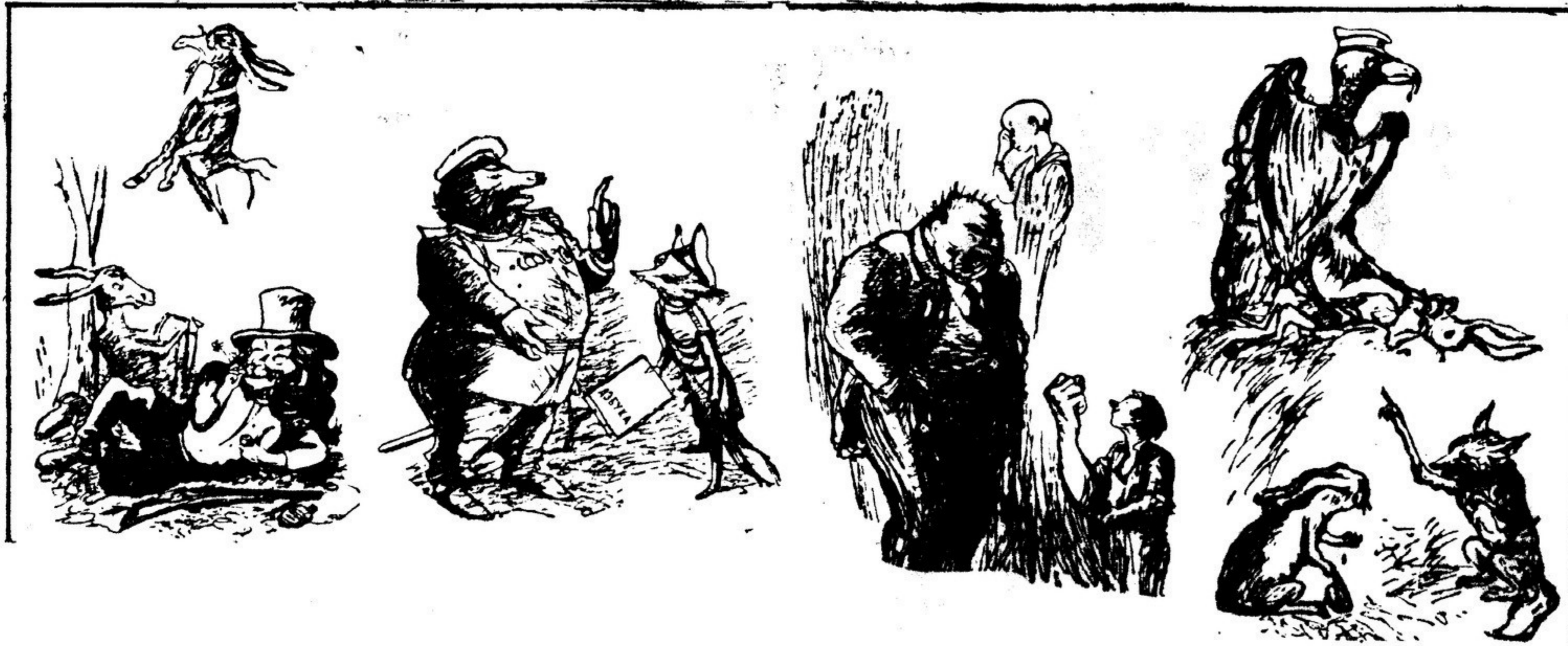
«ОСЕЛ И ЛЕВ»